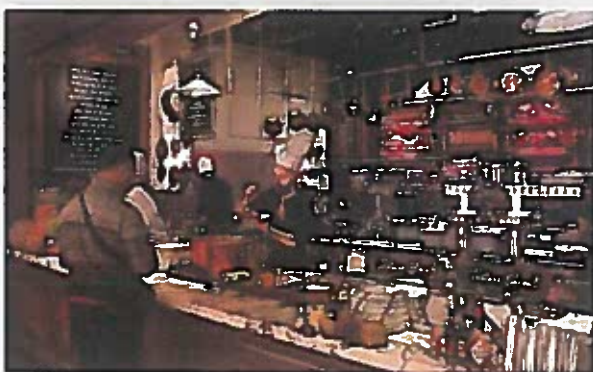
A la rôtisserie del restaurant hi preparen, al moment, infinitat de deliciosos plats típics de la cuina francesa.