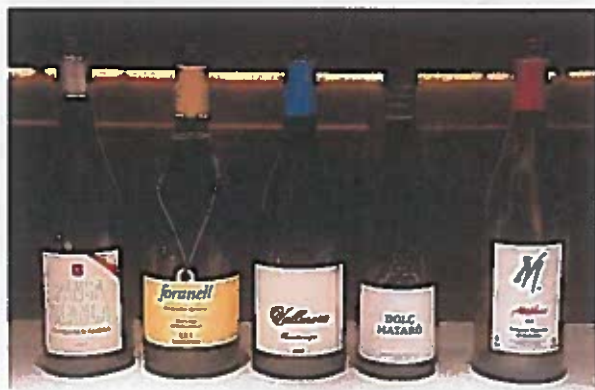
A més dels DO Alella, també vam poder gaudir d'un vi del territori.

ciutat francesa, concretament un vi dolç, el Penjat d'un Fil. Ell també en rep un a canvi. El vi agermana, i compartir dos territoris amants del vi en una mateixa taula fa que, abans d'acabar el dinar, ja tinguem ganes de trepitjar les vinyes de les zones. Avui no podrà ser, però tot fa pensar que el dinar a Les Grands Buffets no s'acabarà amb les postres. ●